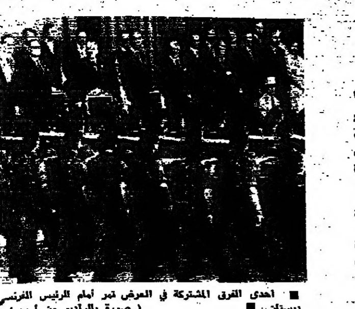
أحدى الفرق المشاركة في العرض تبرأ أمام الرئيس الفرنسي ديستان .

«تصبح قوات لكتيبة العسكرية السريع في حالات الطوارئ» ، كان شعار العرض العسكري الذي أقيم في باريس أمس احتفاءً بعيد 14 تموز . وقد شاهد الرئيس الفرنسي ديستان ، ووزير الدفاع الفرنسي ، والوزراء العرض من على منصة خارج الكتيبة العسكرية الواقعة قرب برج إيفل ، في حين حلت 12 طائرة من طراز «ترانسال» ، التي حققت التحصيل الفرنسي في زائير ، على علو منخفض فوق العاصمة مغربية بدء العرض الذي استمر ساعة واحدة . وقد شارك في العرض سرب من طائرات «فوغا ميستر» ، و«طفرات» ، و«ديغ سي» ، و«أريسون» طراز «جنفان» ، و«النتا» عشرة طائرات هليكوبتر من طراز «بوما 330» . باريس - أش.أ.د.ص.ف.